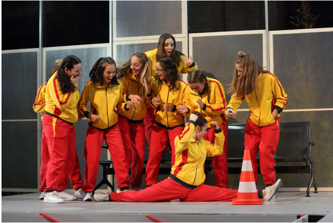
MTDUPQNE II © Susana Neves