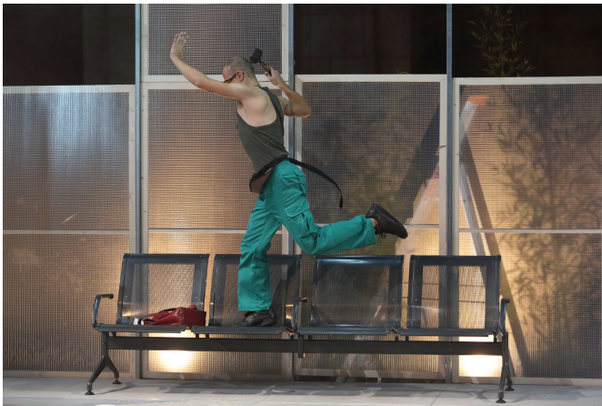
MTDUPQNE IV © Susana Neves