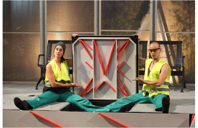
MTDUPQNE III © Susana Neves