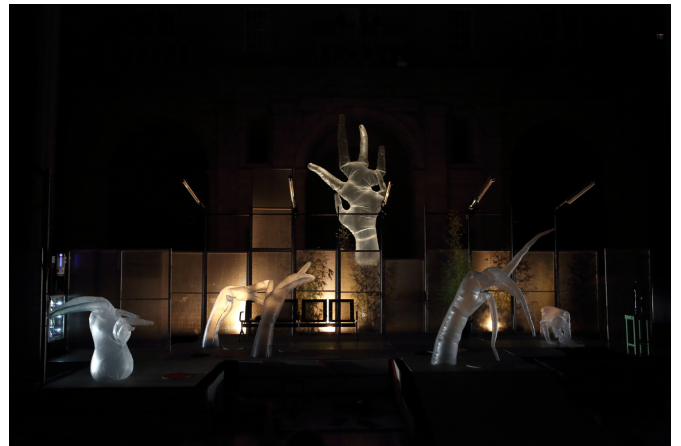
MTDUPQNE V © Susana Neves