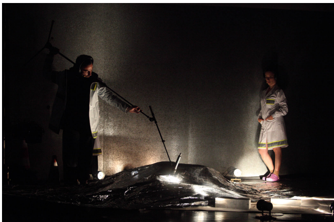
Acidente 2 © Susana Neves