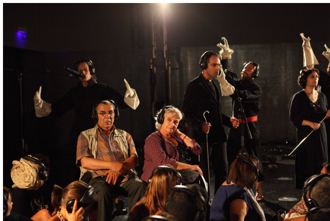
Acidente 3 © Susana Neves