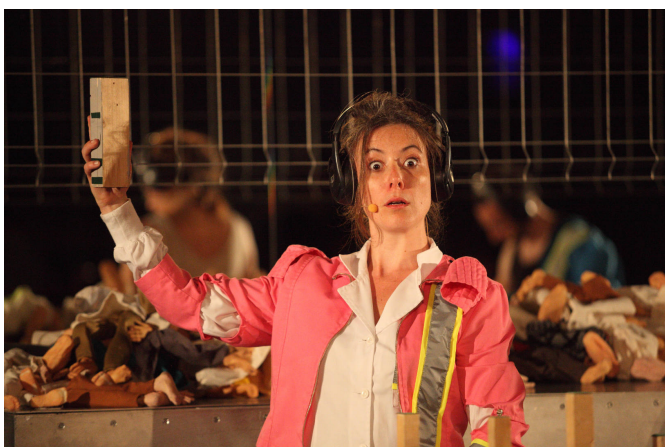
Acidente 4