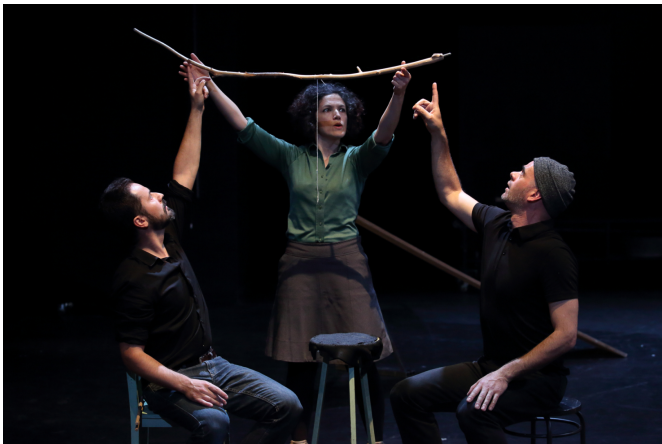
OEP © Susana Neves