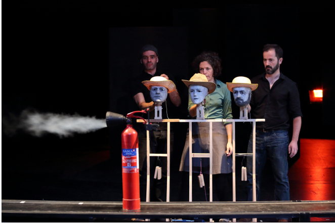
OEP III