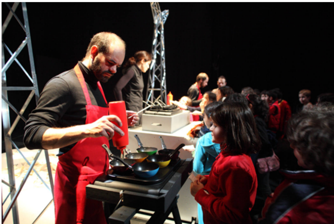
pandora 3