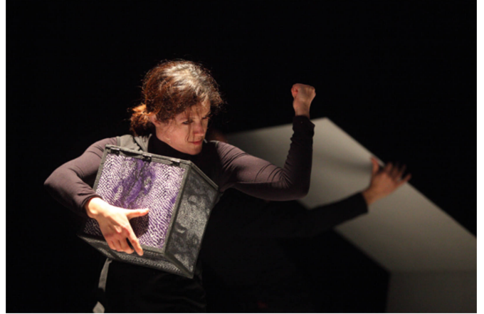
pandora 2